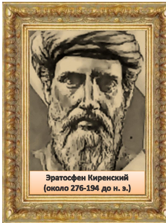
Эратосфен Киренский (около 276-194 до н. э.)