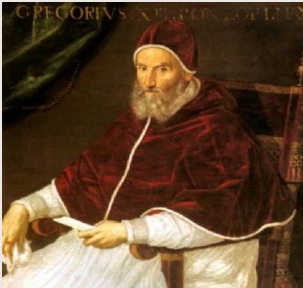
Григорий XIII (1502-1585 г.г.)