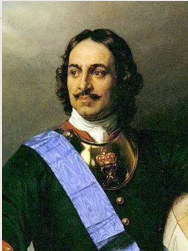
Петр I (1672-1725 г.г.)