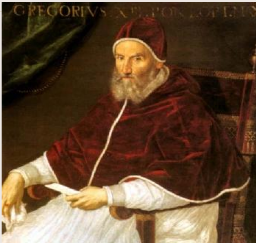
Григорий XIII (1502-1585 г.г.)