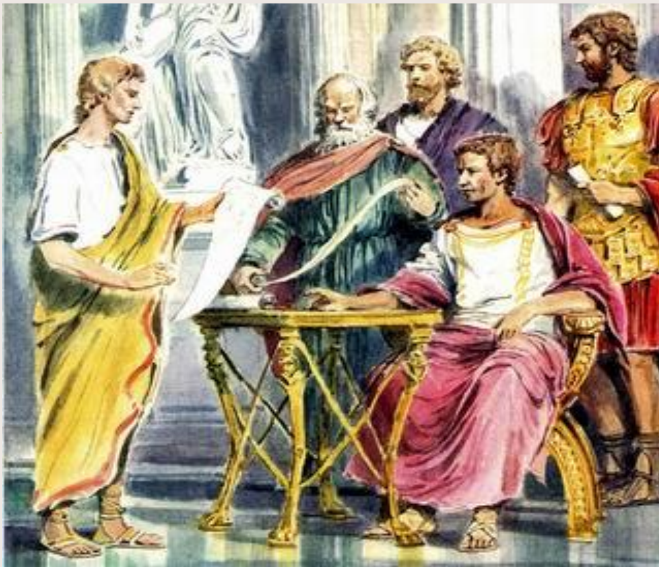
Созиген показывает новый календарь Юлию Цезарю. Рисунок современного художника