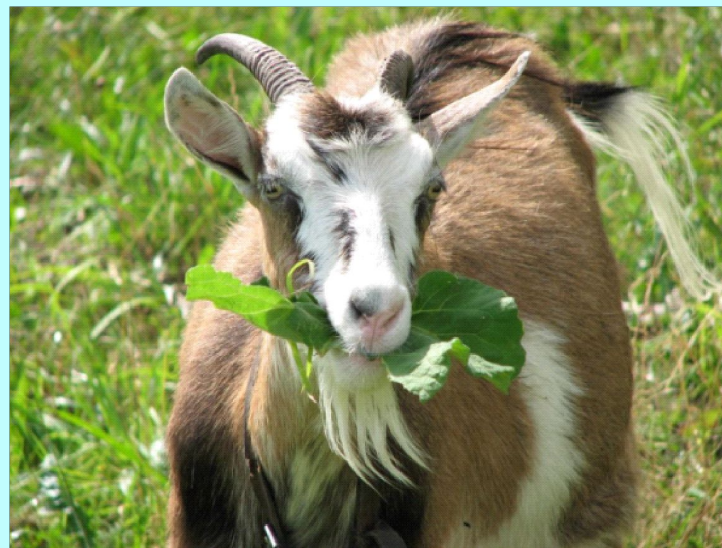
Козы - 18 лет