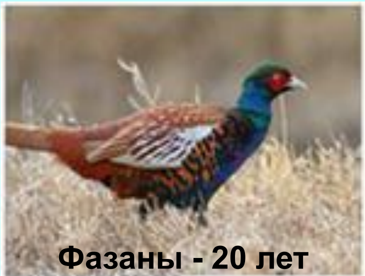
Фазаны - 20 лет