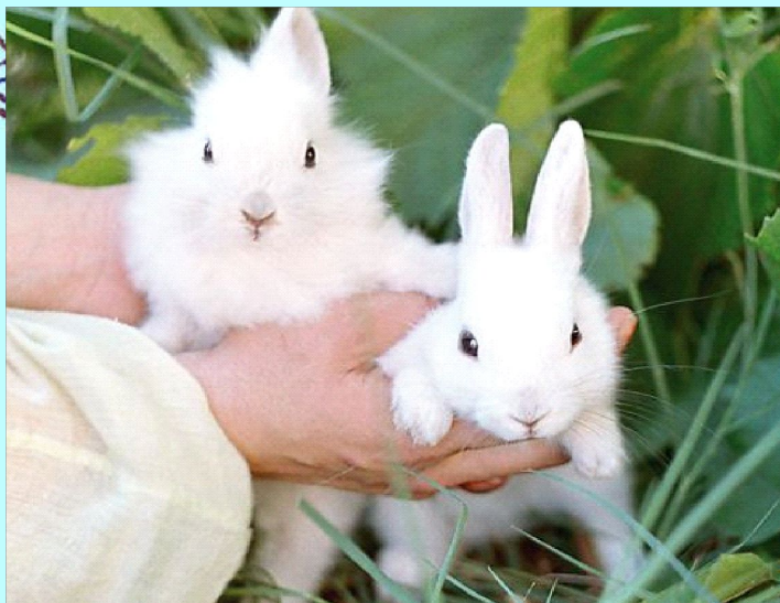
Кролики - 12 лет