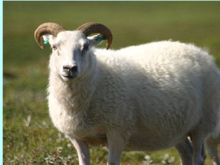
Овцы - 14 лет