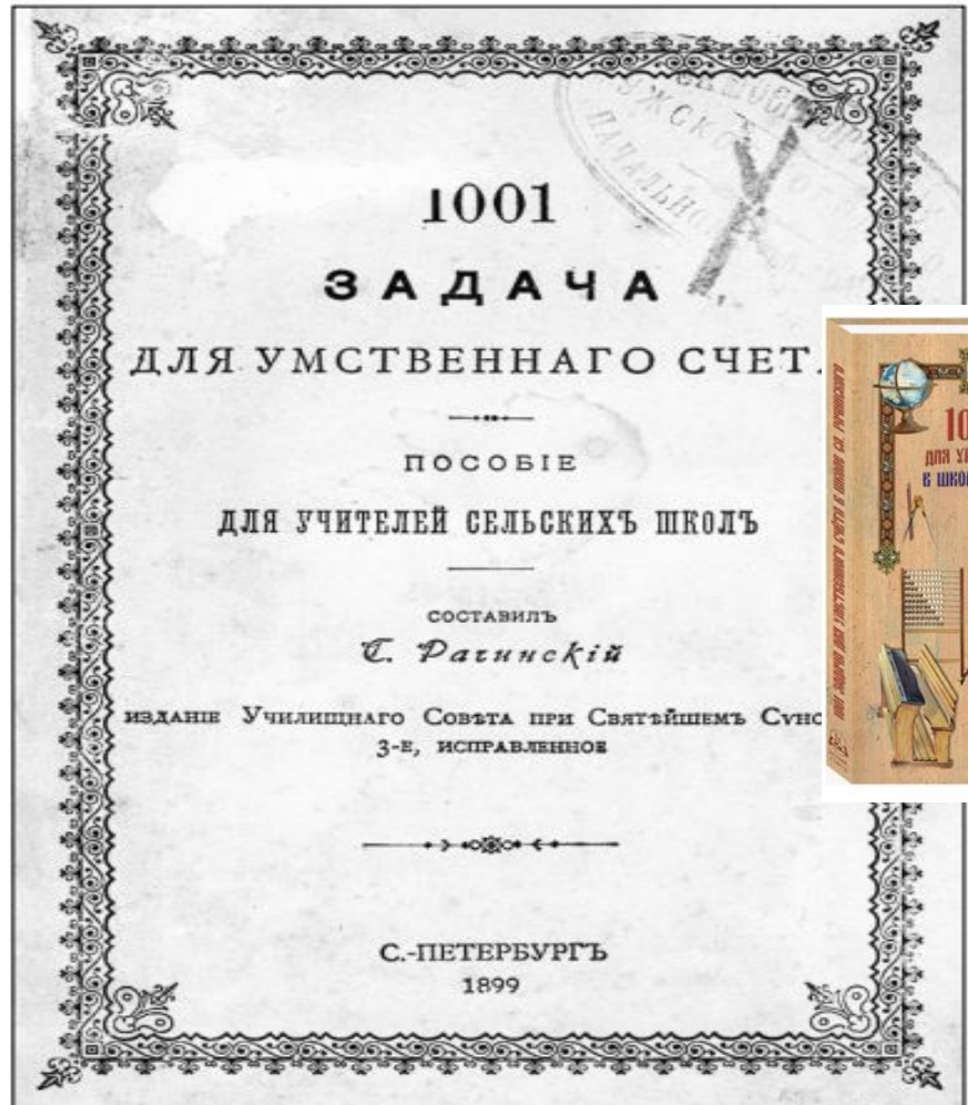
Обложка 3-го издания задачника С.А. Рачинского. 1899 г.