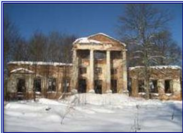
Рачинский Сергей Александрович