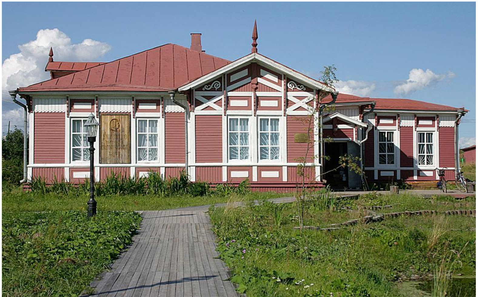
Музей М.В.Ломоносова , Архангельская область