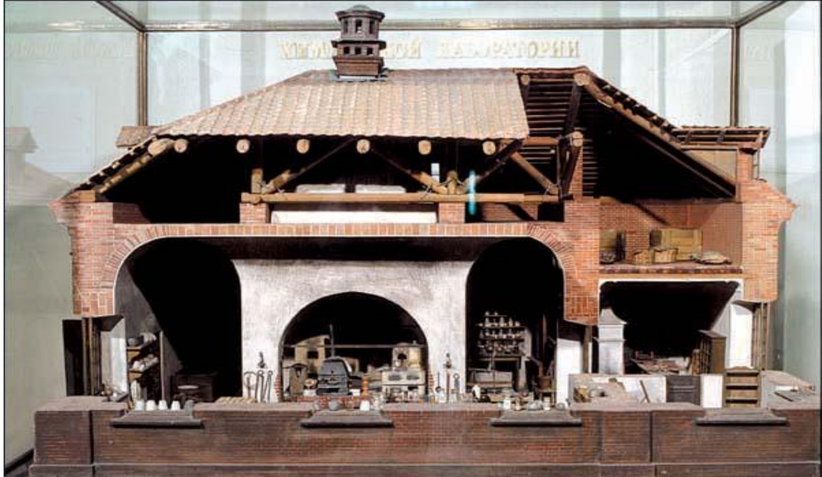
Макет химической лаборатории М.В. Ломоносова