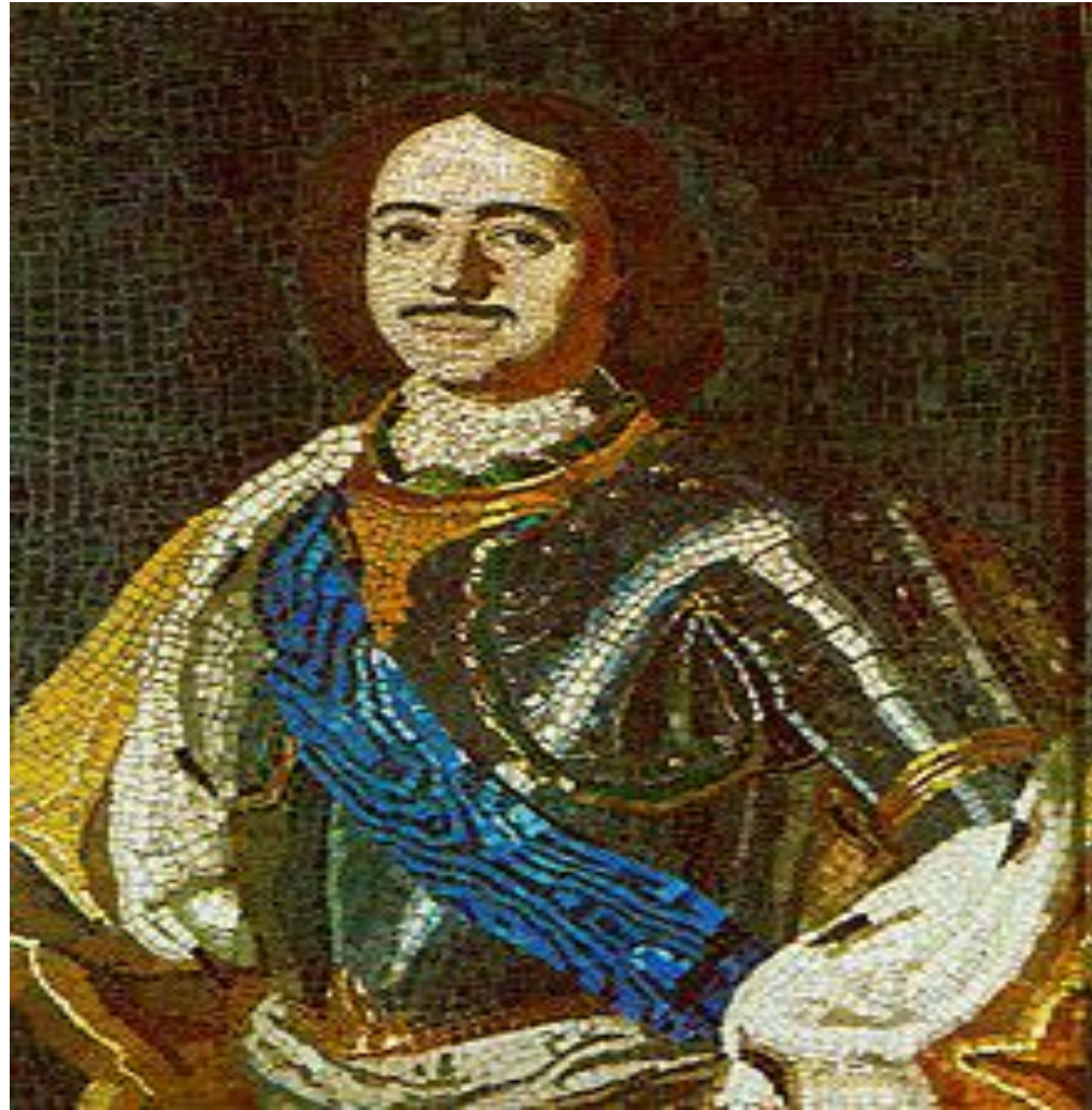
Портрет Петра I. Мозаика. Набрана М. В. Ломоносовым. 1754. Эрмитаж