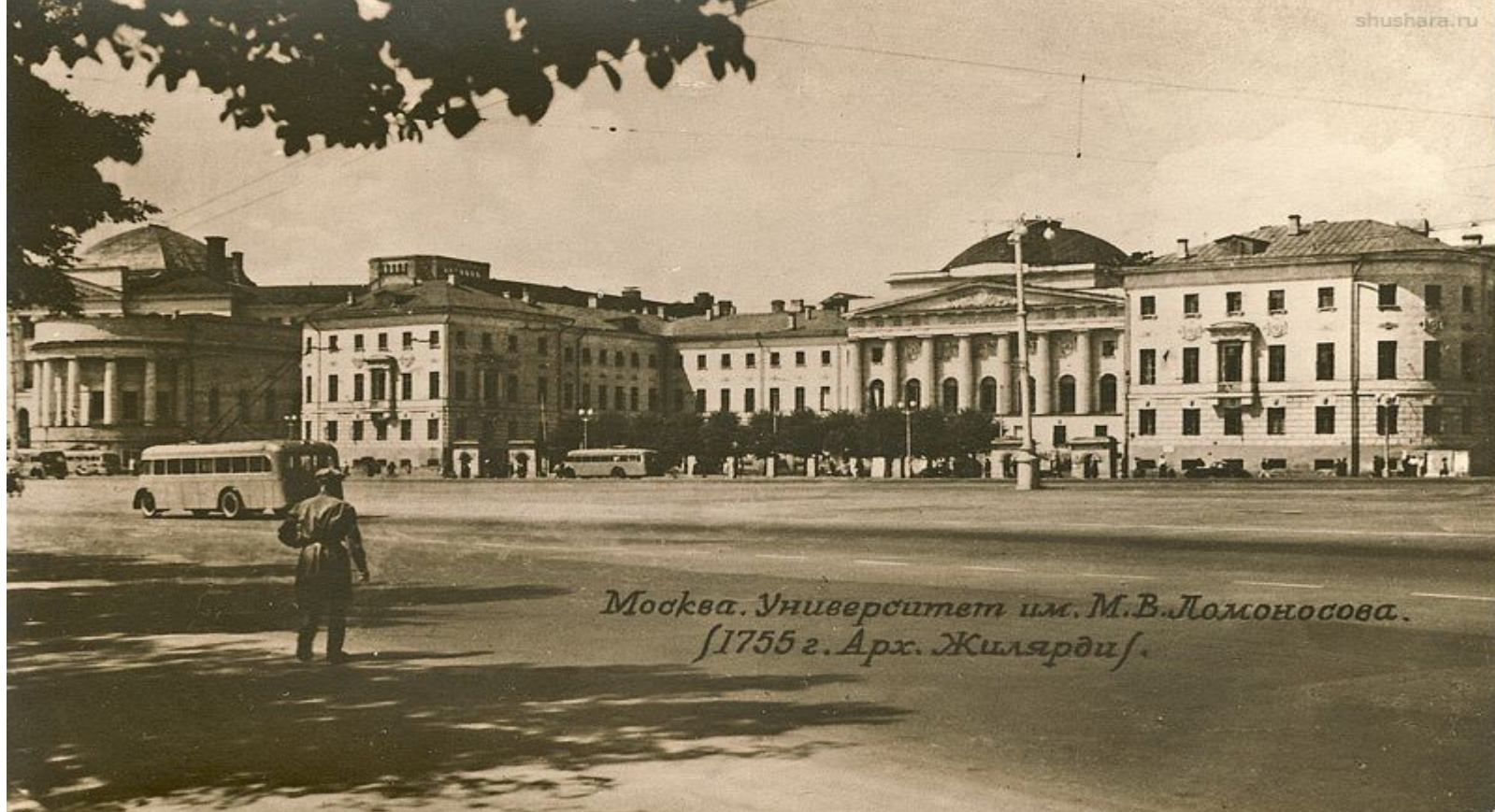
Москва. Университет им. М.В. Ломоносова. 1755 г. Арх. Жильярди.

Он находится на улице Моховой дом 9. В нем сейчас находится факультет психологии.