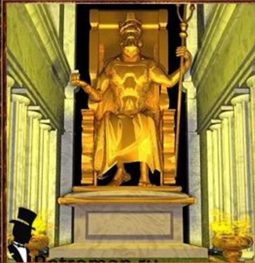
Статуя Зевса в Олимпии.