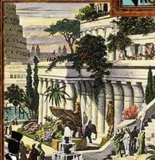
Висячие сады Семирамиды.