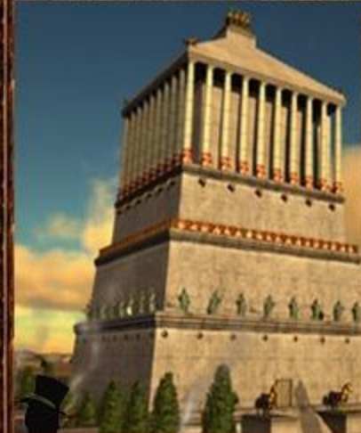
Мавзолей в Галикарнасе.