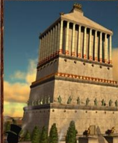
Мавзолей в Галикарнасе.