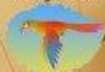
Стрельба по попуазам