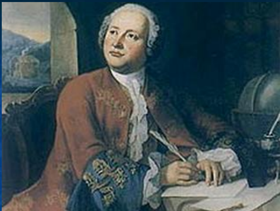
Михаил Васильевич Ломоносов