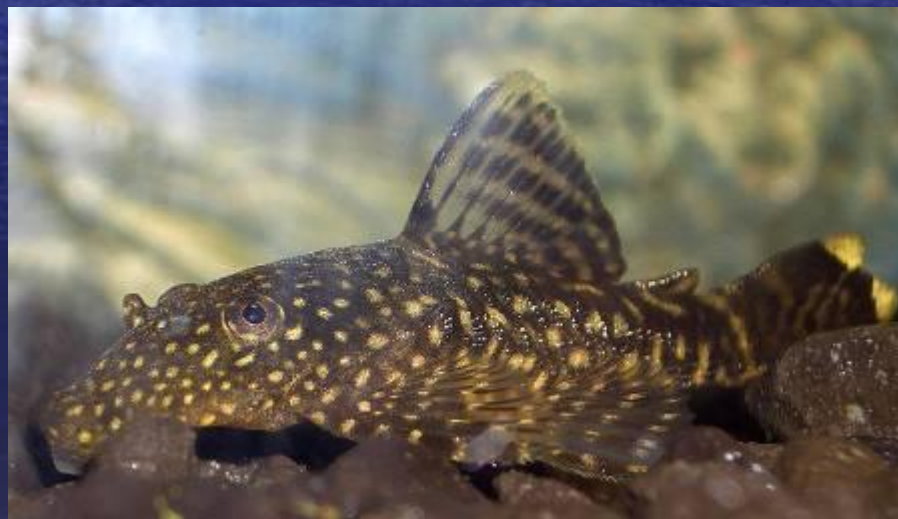
Кольчужные сомы – анциструс