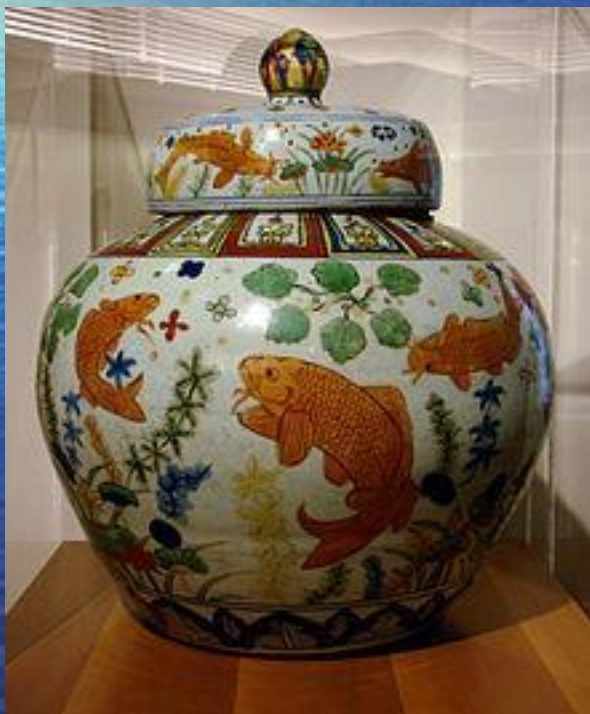
Ваза периода династии Мин, (1522—1566), музей Гиме, Париж

Первые упоминания о разведении рыб связаны с Египтом и Ассирией. В Египте уже несколько тысячелетий назад начали разводить африканских тиляпий . Архитекторы Вавилона , в висячих садах Семирамиды создавали открытые декоративные пруды с рыбами ещё в IX в до н. э. Во дворцах для тех же целей устанавливались каменные чаши-бассейны. Разведенные рыбы , прирученные домашние животные принесли человеку лавры царя природы.