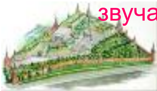
Схема расположения башен Московского Кремля