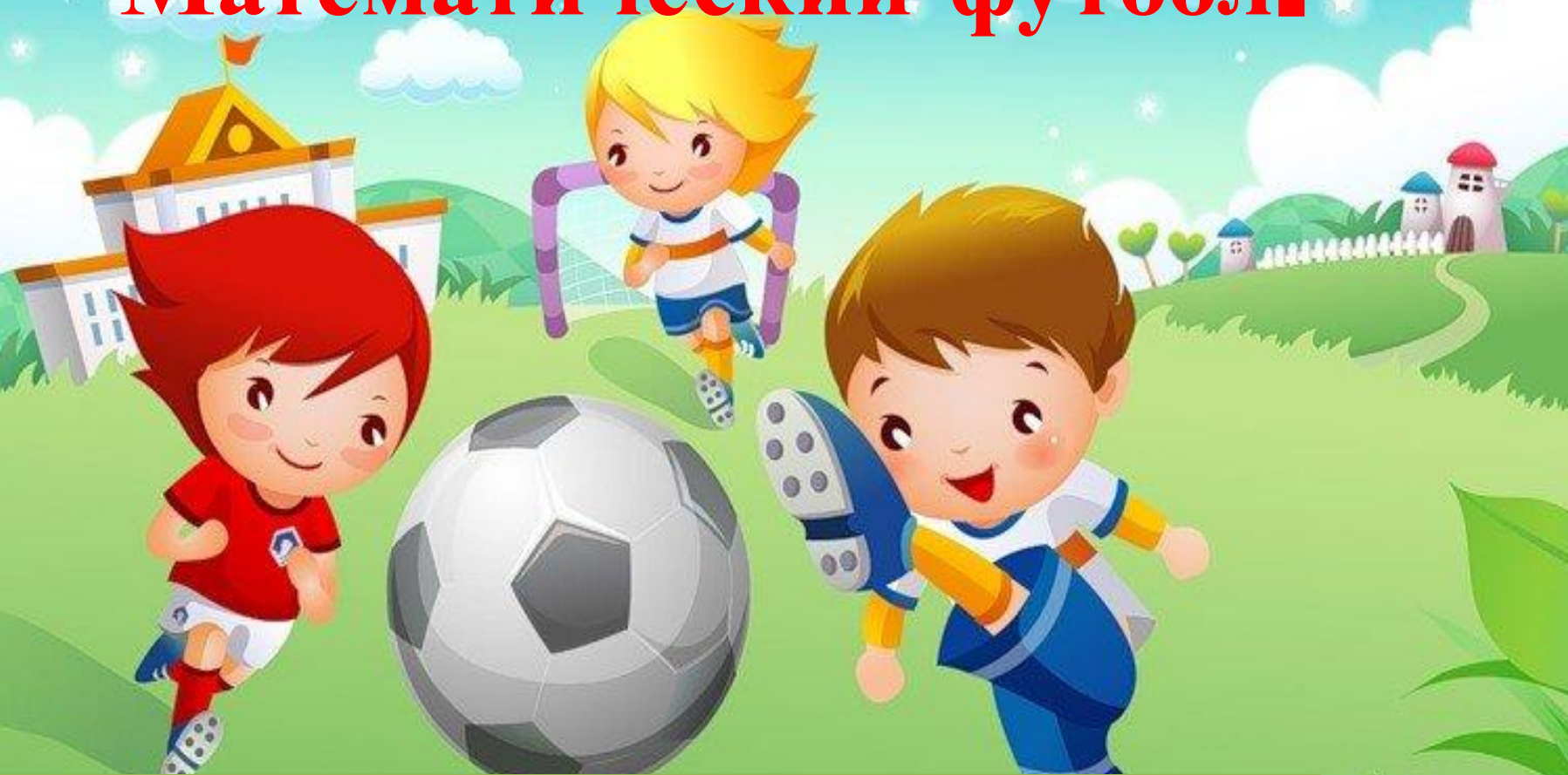
Таблица умножения , деления на 6