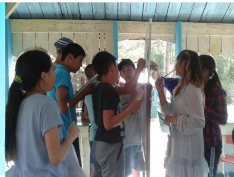
Составление ИОП на 3 дня в первый день