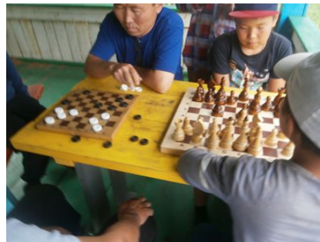
Шашки и шахматы