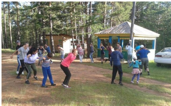
Игра «Чуки на пшоду»