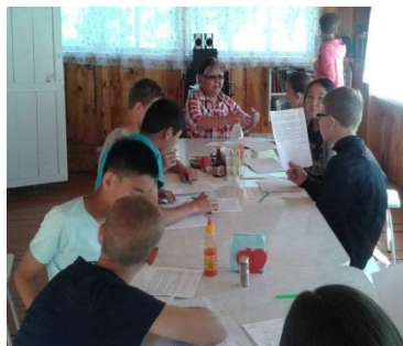
Методика Ривина. Русский язык