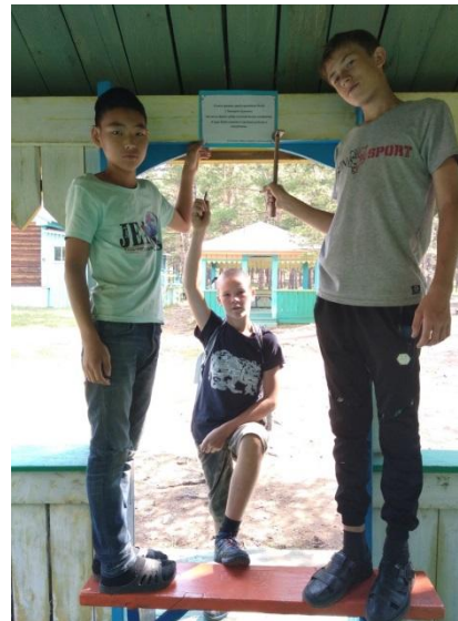
Проект «Фото-видео студия»