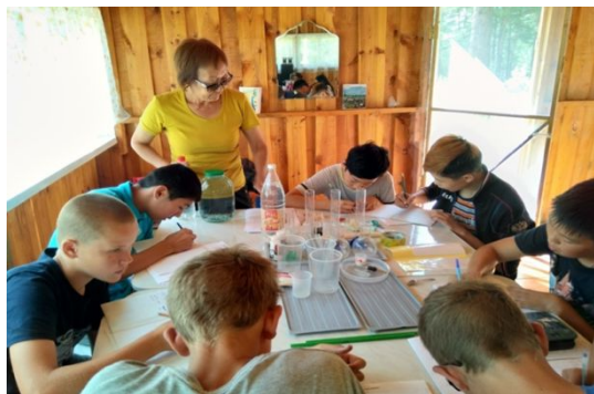
Проект «Вода-бесценный дар природы»