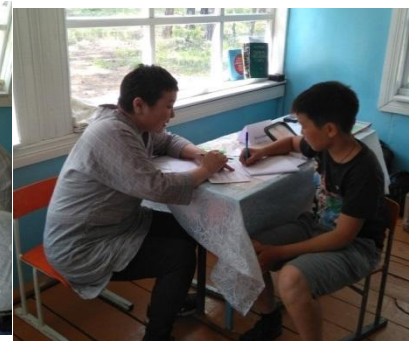
Индивидуальная работа с учителем