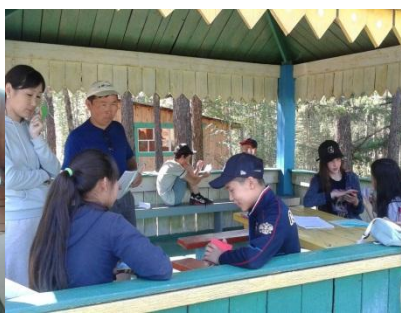
Взаимотренаж. Английский язык