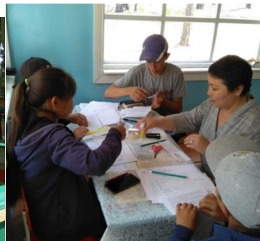
Взаимообмен заданиями. Математика