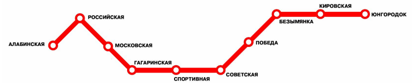
Карта линий Самарского метрополитена

Самарский метрополитен открыт в 1987 году Количество станций на сегодняшний день – 10 Протяженность линии 11,6 (км)