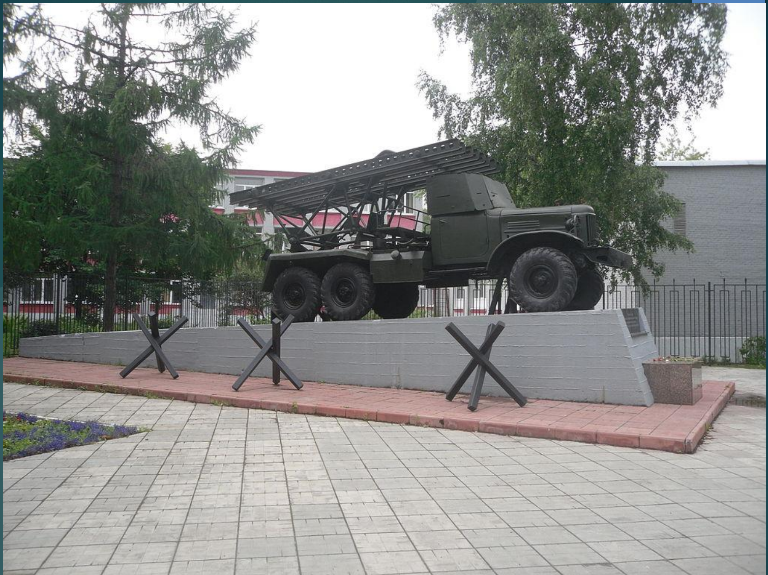
г. Балашиха, ул. Советская. Монумент в память о подвиге воинов батареи гвардейских миномётов «Катюша» под командованием Героя Российской Федерации Ивана Андреевича Флёрова.