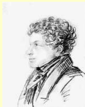
Брат, Лев Сергеевич Пушкин (1805-1852г.)