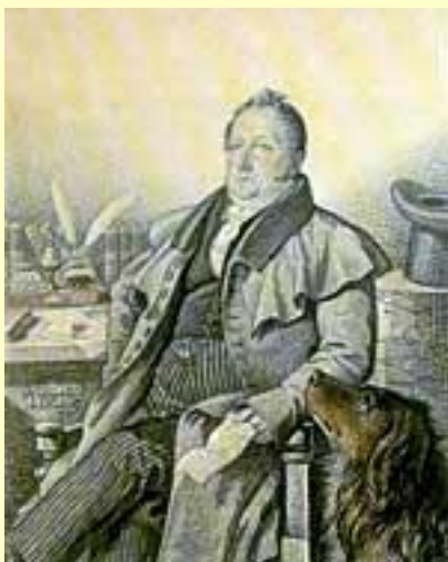
Отец , Сергей Львович (1770-1838г.), принадлежал к древнему дворянскому роду, упоминаемому в Летописях со времен Ивана Грозного