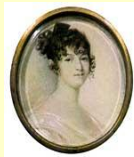
Мать, Надежда Осиповна Пушкина (1775-1836г.) , была внучкой Ибрагима Ганнибала – «арапа Петра Великого»