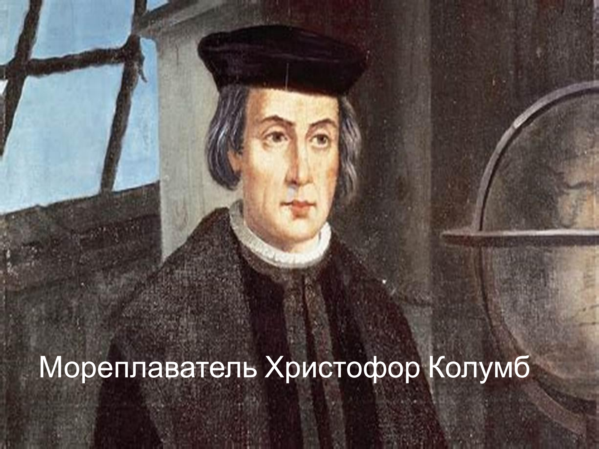
Мореплавателъ Христофор Колумб