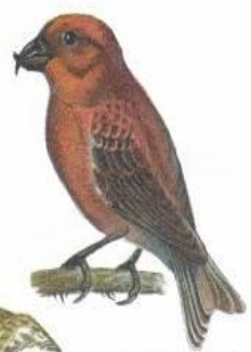
Клёст-еловик (до 19 см)