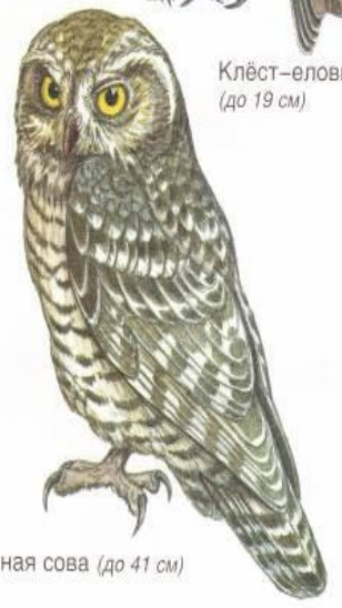
Ястребиная сова (до 41 см)