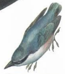
Поползень (до 16 см)