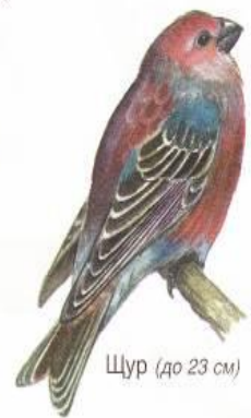
Щур (до 23 см)