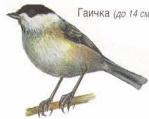
Гаичка (до 14 см)