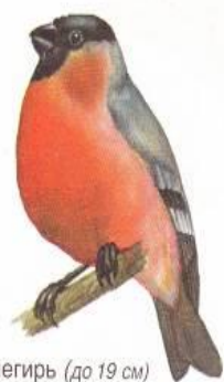
Снегирь (до 19 см)