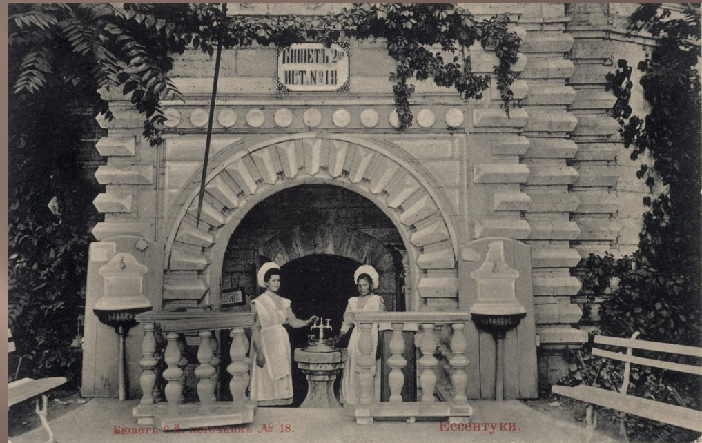
Бюветъ 2-й. Источникъ № 18.