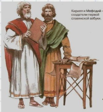
Кирилл и Мефодий – создатели первой славянской азбуки.