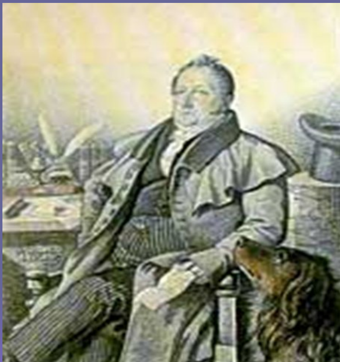
Сергей Львович Пушкин (отец поэта)