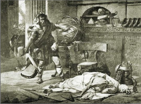
Смерть Архимеда по одной из версий

Рассказ о смерти Архимеда от рук римлян существует в нескольких версиях: