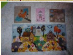
Метод коллективных и групповых работ