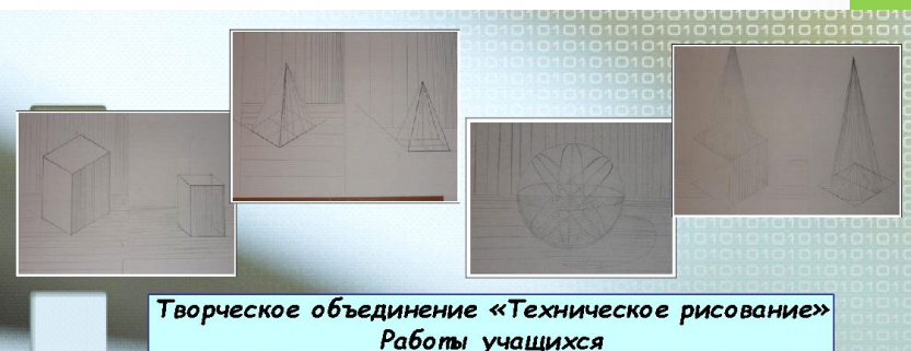
Творческое объединение «Техническое рисование» Работы учащихся