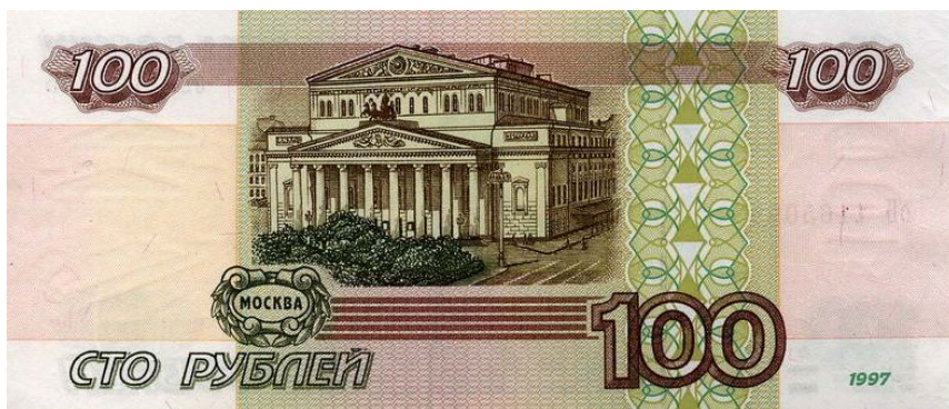
Купюра в 100 рублей