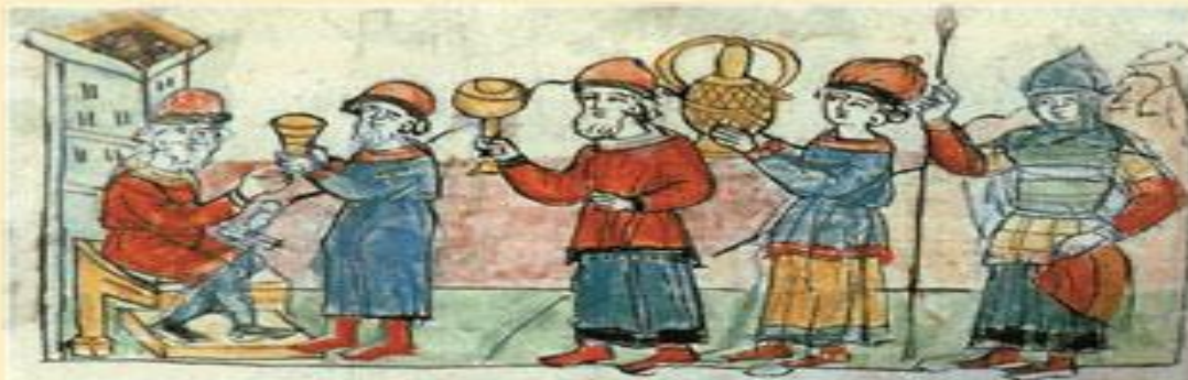
Греки платятъ дань Олегу. Радзивилловская летопись

1. «Мы отъ рода Рускаго, Карлы, Шнегелдъ, Фарлофъ, Веремудъ, Рулакъ, Гуды, Руаддъ, Барихъ, Фреланъ, Рюаръ, Актеву, Труанъ, Лидуль-фостъ, Стемидъ, иже послани отъ Олга великаго князя Рускаго, и отъ всѣхъ, иже суть подъ рукою его, свѣдѣлахъ бояръ, къ вамъ, Львови и Александру и Константину, великимъ о Бозѣ самодержьцемъ, царемъ Грецкимъ, (**) на удержаніе и