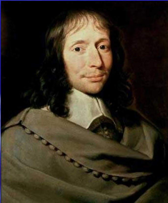
Блез Паскаль французский ученый 19.06.1623- 19.08.1662

Предмет математики настолько серьезен, что полезно не упускать случаев делать его немного занимательным