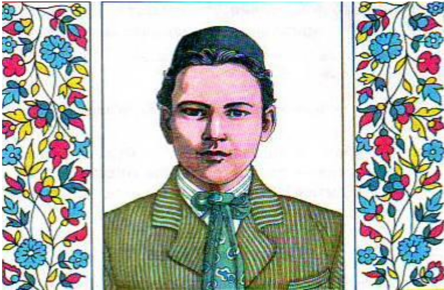
Габдулла Тукай ( 1886-1913 )