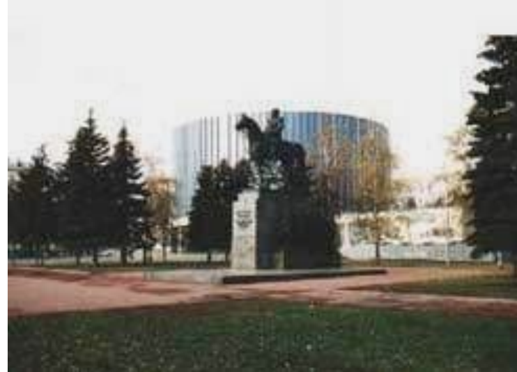
Панорама "БОРОДИНСКАЯ БИТВА"