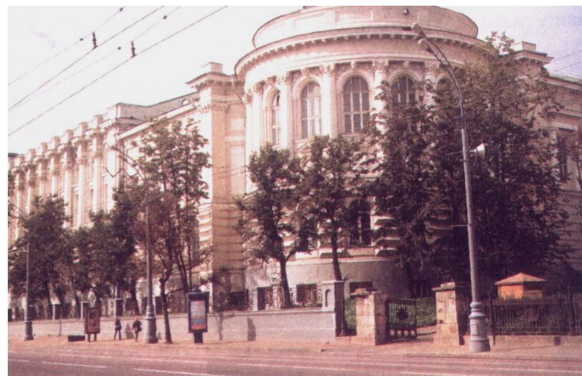
Здание научной библиотеки МГУ имени М.Горького