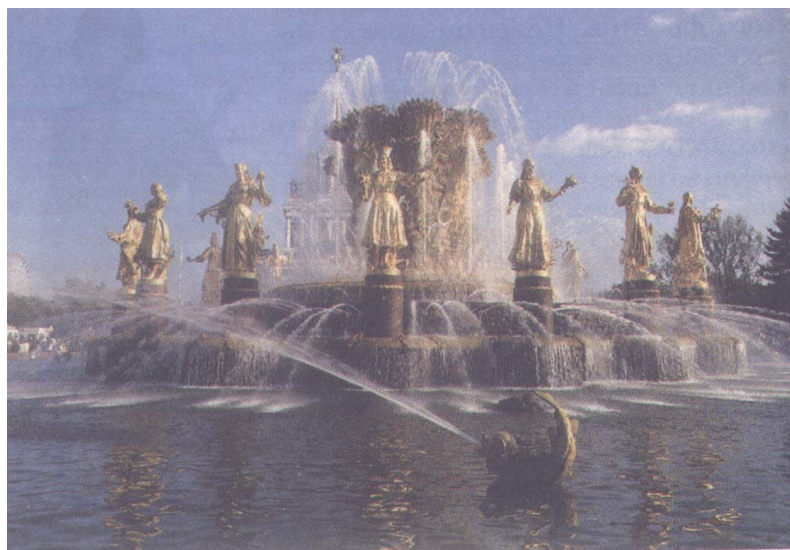
Фонтан «Дружба народов» во Всероссийском выставочном центре Сооружен в 1957г.