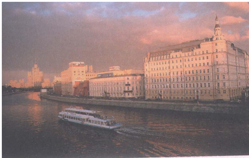
Прогулочный трамвайчик на Москве-реке