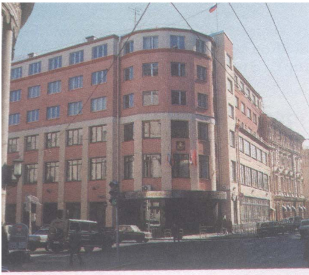
Здание Московской городской думы