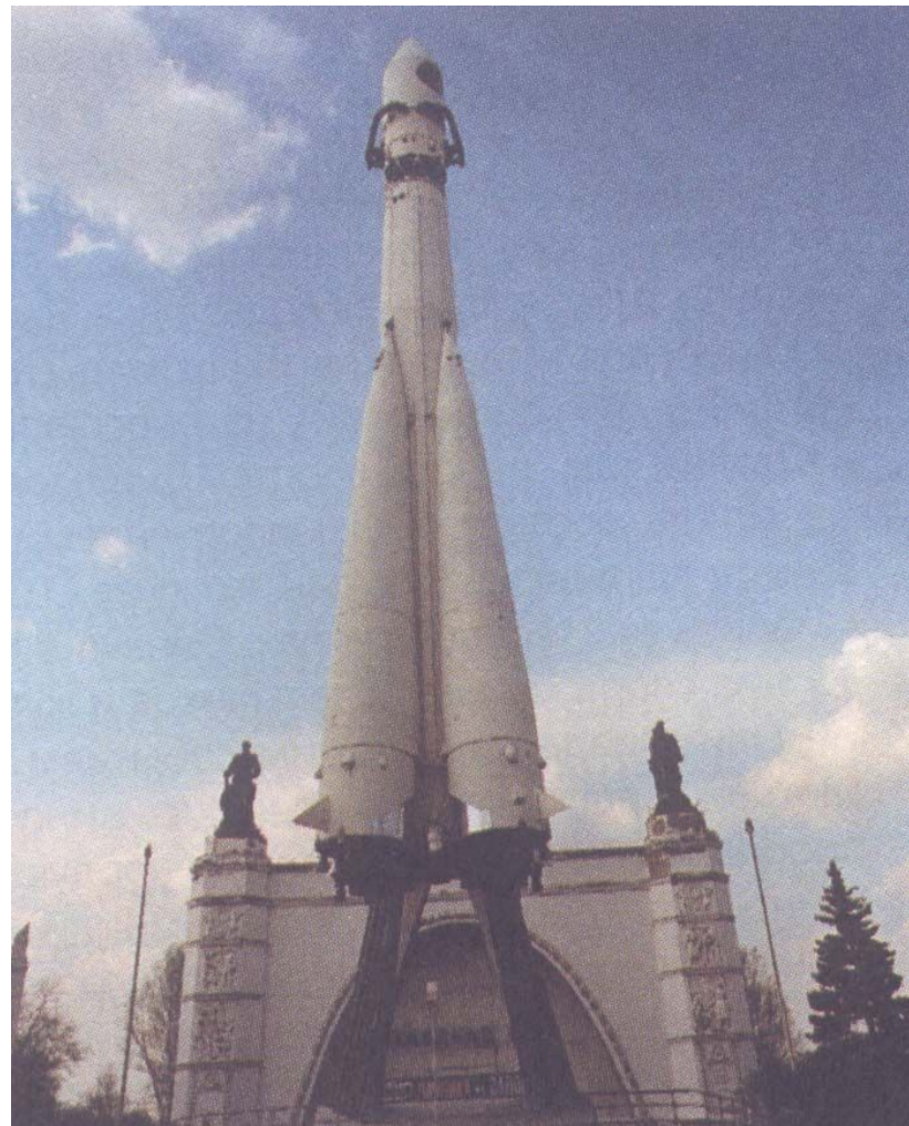
Ракета-носитель «Восток» перед главным входом в павильон «Космос» во Всероссийском выставочном центре