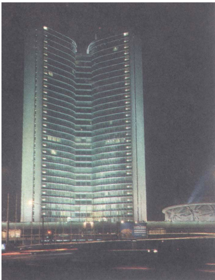
Административное здание на Новом Арбате