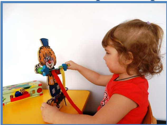
Закрепление знаний о предметах (длинный – короткий)