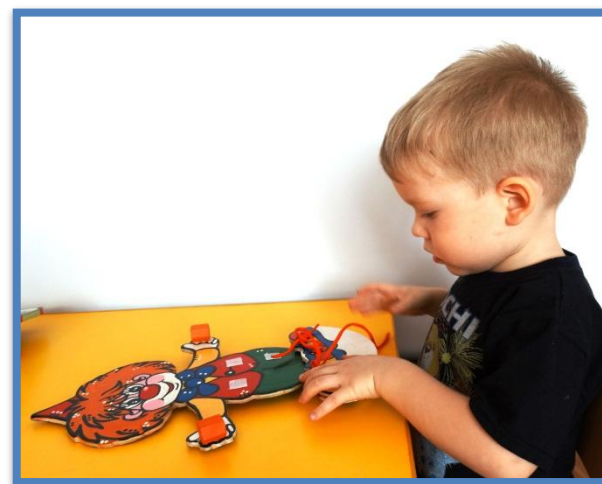
Развитие мелкой моторики - шнуровка