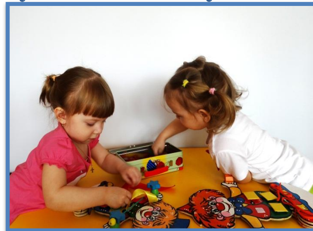
Обобщение предметов по определенному признаку (форма, цвет)