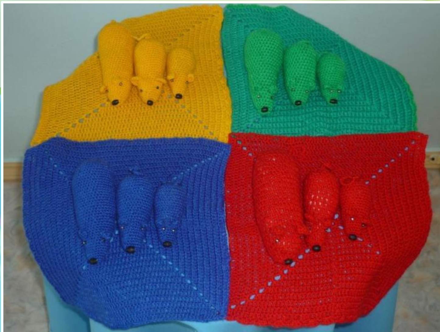
Дидактическое пособие «Мышиная семейка»