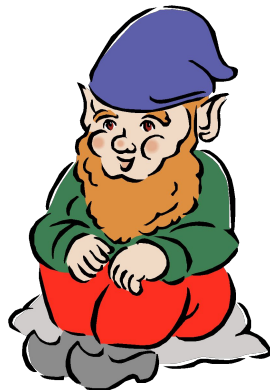
второй день недели вторник