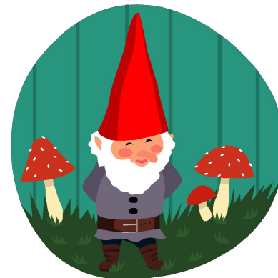
седьмой день недели воскресенье