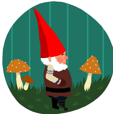
шестой день недели суббота