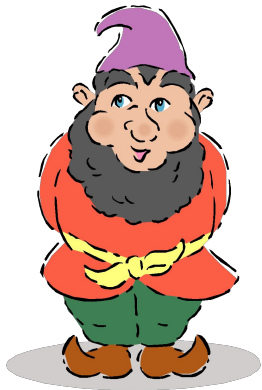
первый день недели понедельник

К нам в гости пришли гномики – друзья радуги.