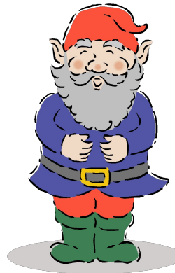
третий день недели среда