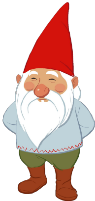
пятый день недели пятница