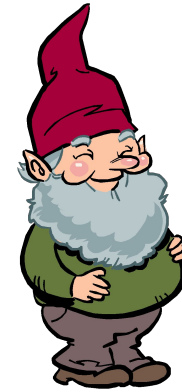
четвёртый день недели четверг