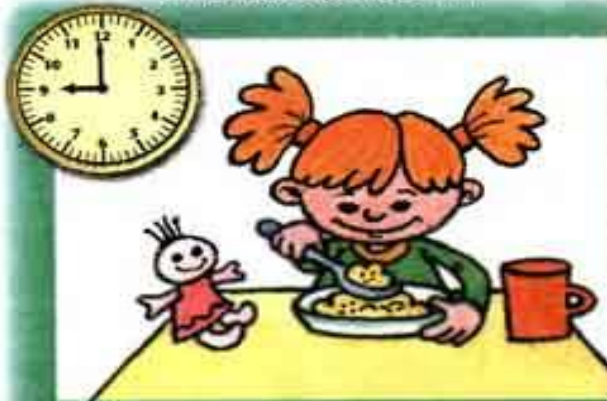
Лиза завтракает в...