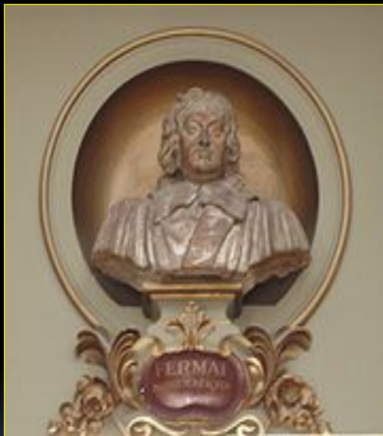
Бюст Ферма в тулузском Капитолии