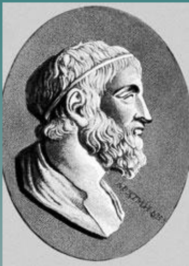
Архимед (287-212 г. до н. э.)