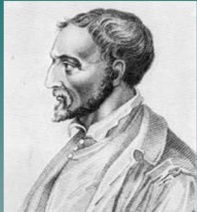
Кардано (1501-1576 г.)