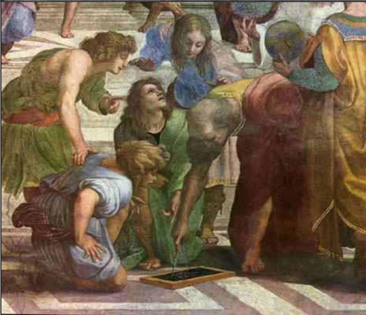
Рафаэль Санти, Евклид, деталь 1508-11, фреска "Афинская школа" Станц делла Сеньятура, Ватикан, Рим, Италия