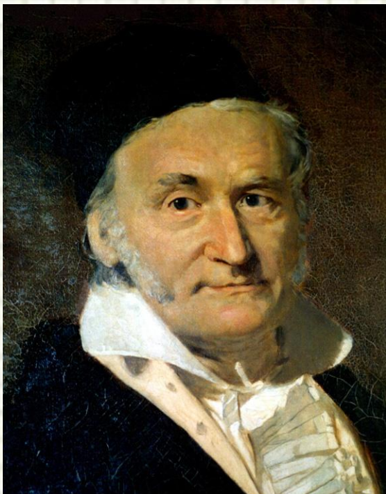
К. Ф. Гаусс