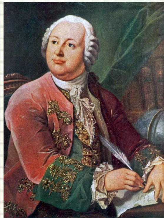
М. В. Ломоносов