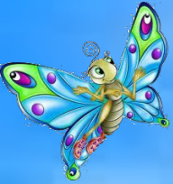
Таблица умножения на 3 и 4

Автор: Пронюшкина Светлана Николаевна МБОУ СОШ № 31 г.Тула