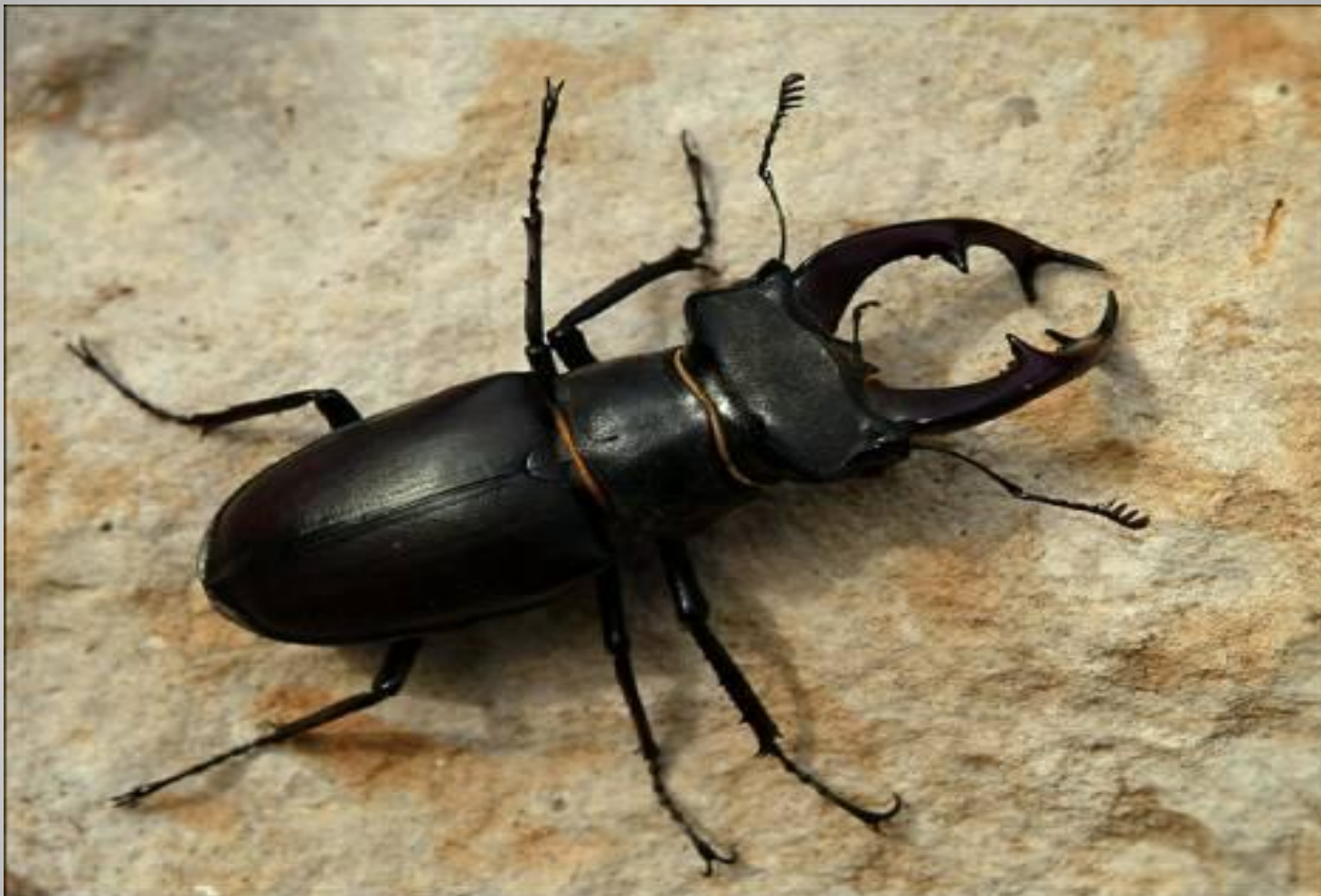
Жук- олень - 7 см