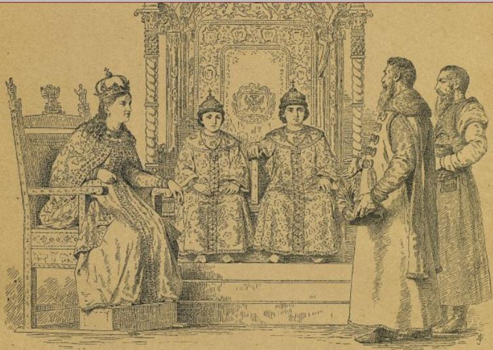
Цари Іоаннъ и Петръ Алексѣевичи. Правительница Софія Алексѣевна. 1682—1689г.