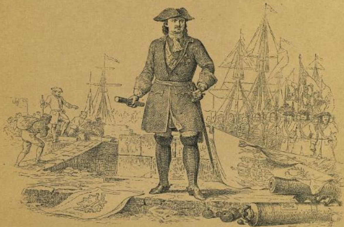
Императоръ Петръ I й Великій

Одаренный необычайной живознательностью и гениальными способностями, "Отец Отечества", Петр I основатель С. Петербурга, творец русского флота, покоритель Карла XII проникнутый заботами о России, явился безмерным просветителем и славным Россію из Европы, сама служба примером, онз насадил на родной почве знаніе, трудъ и промышленность, пріучая русскихъ людей дѣйствовать самобытно.