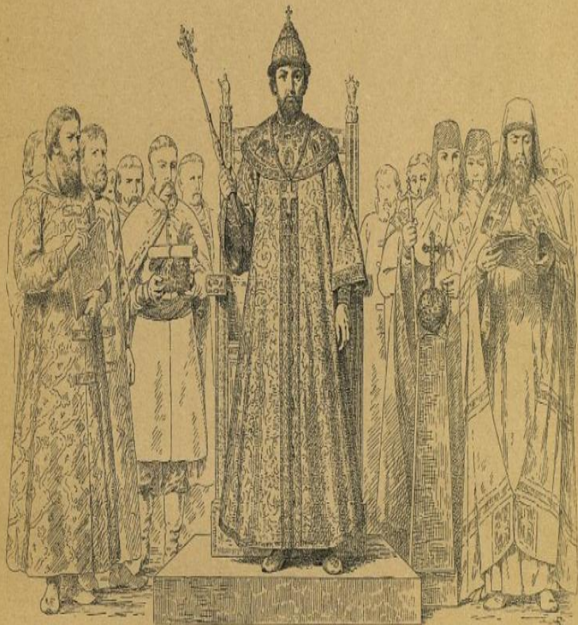
Самодержец Царь Алексей Михайлович. 1645—1676г.

Петр родился в Москве, в Кремле, 30 мая 1672г. Он был четырнадцатое дитя многосемейного царя Алексея и первый ребенок от его второго брака – с Натальей Кирилловной Нарышкиной. Как только Петр стал помнить себя, он был окружен в своей детской иноземными вещами; все во что он играл, напоминало ему немца. Двухлетнего Петра забавляли музыкальными игрушками немецкой работы. На четвертом году Петр лишился отца.