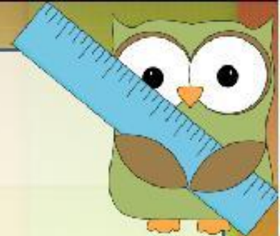
Таблица умножения на 3

Автор: Т.В. Молочева МБОУ лицей №1 г. Комсомольск-на-Амуре