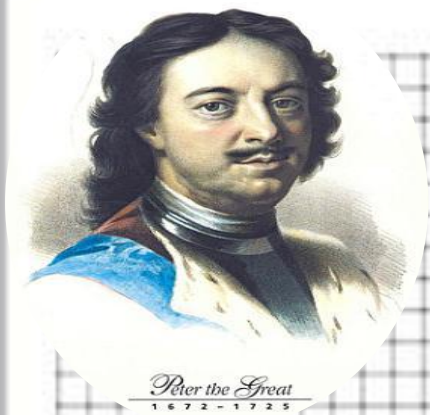
Peter the Great 1672-1725

Первый русский император Пётр I ложился спать в 9 часов вечера, а просыпался в 2 часа ночи. Всё остальное время он работал. Сколько часов продолжался его рабочий день?