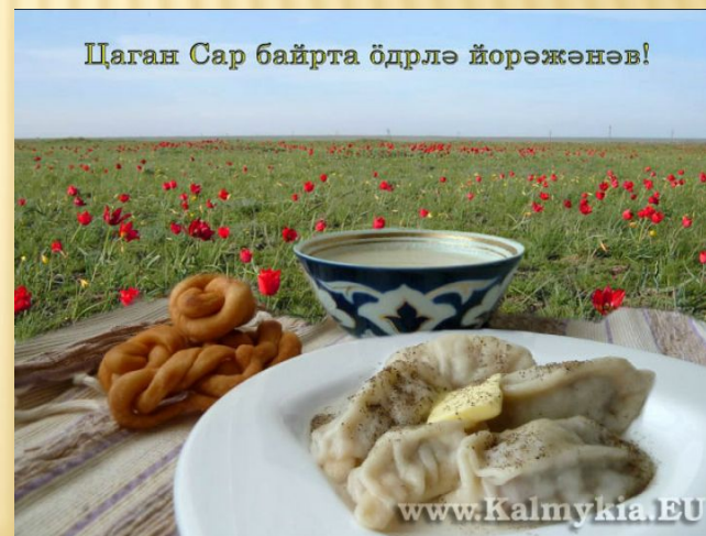
4. Цаган -Сар