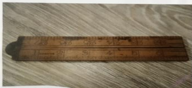
Каждый купил на свой аршин мерит.

Сидит, вгляд, словно аршин проглотил. — Говорит к человеку с несущественно прямой осанкой. На аршин борзид, да уши на пядь. — О взрослом, но глупом человеке. На три аршина в штык вгляд. — О аршинном человеке, от которого ничего невозможно узнать. Словенка и кузнечик борзид к аршину. — О наивысоком фабрикатном человеке.