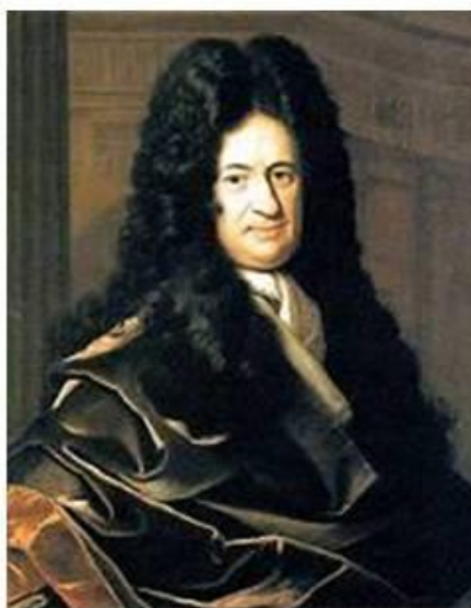
Готфрид Вильгельм фон Лейбниц