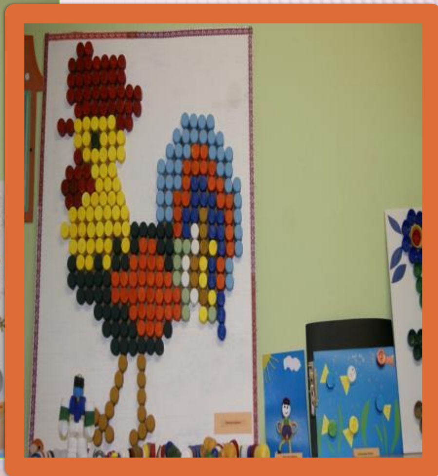
Семейный конкурс поделок «Забавные крышки»