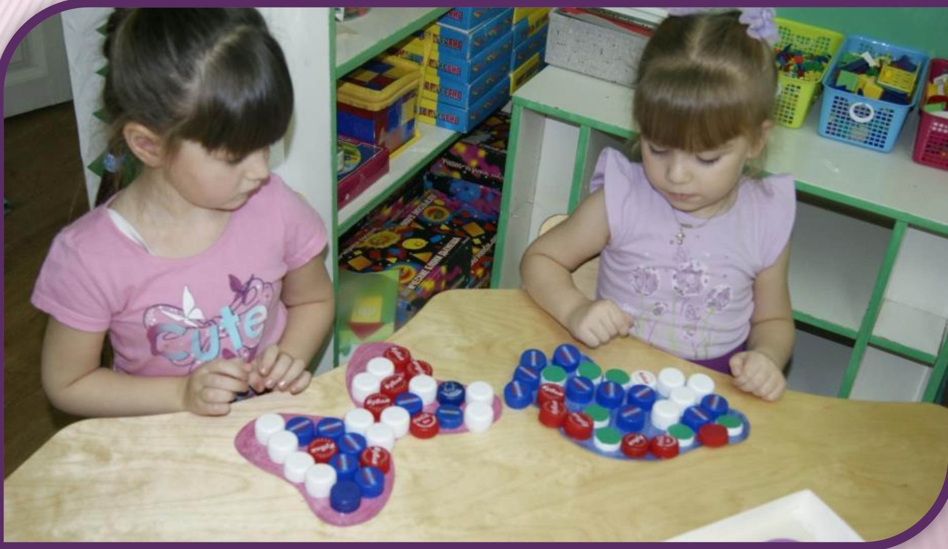
Первые игры с крышками