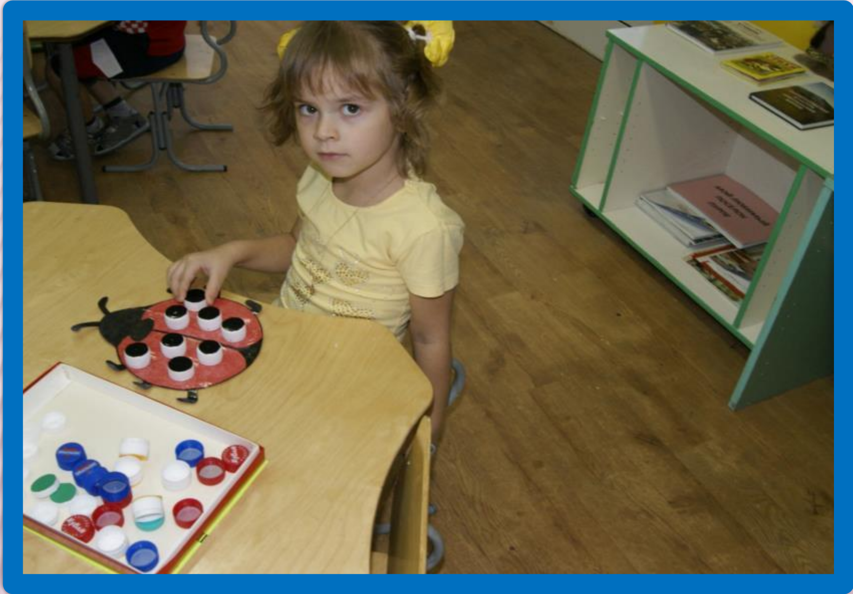
ДИДАКТИЧЕСКАЯ ИГРА «ЦВЕТНЫЕ ПЯТНЫШКИ»