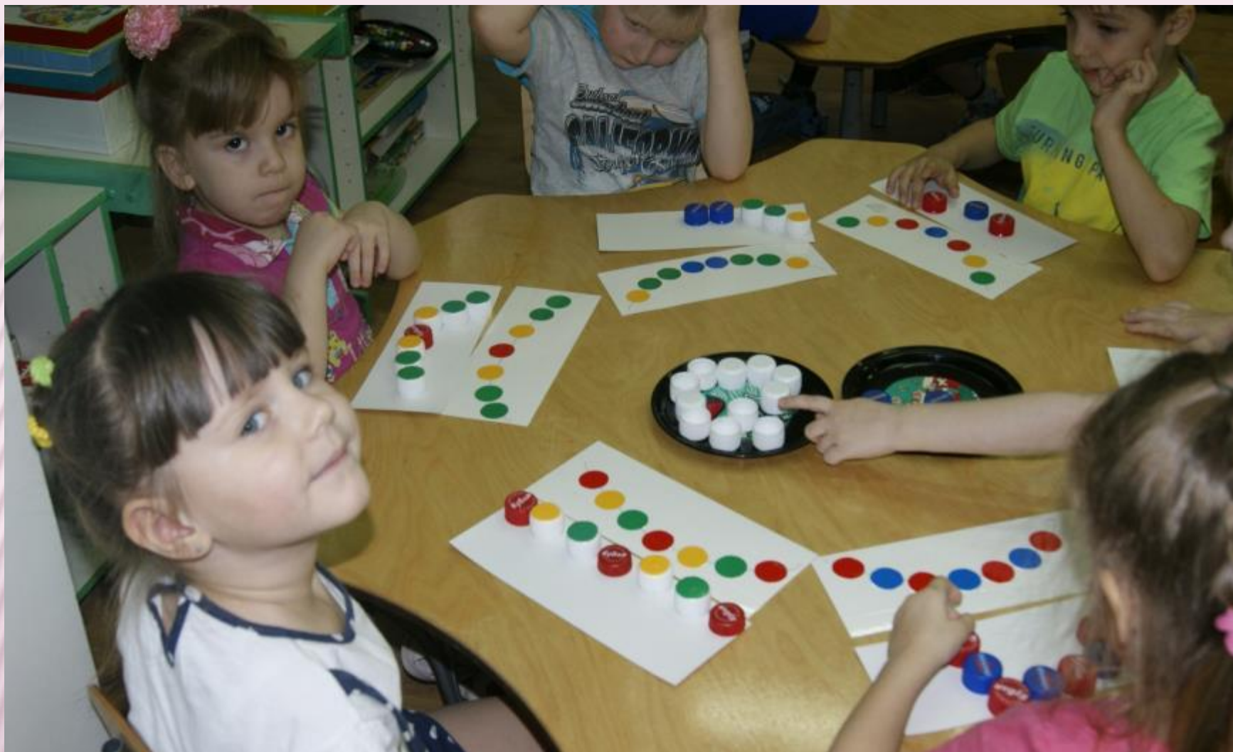
ДИДАКТИЧЕСКАЯ ИГРА «РАЗНОЦВЕТНЫЕ БУСЫ»