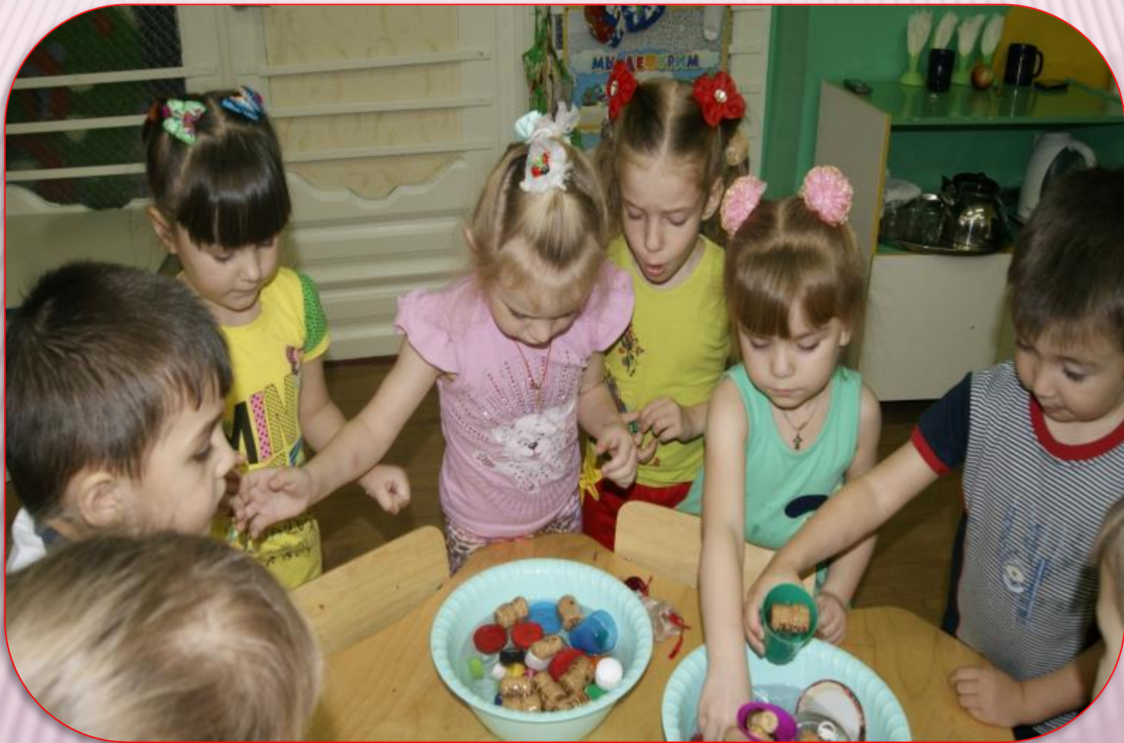
Первый опыт: тонут – не тонут