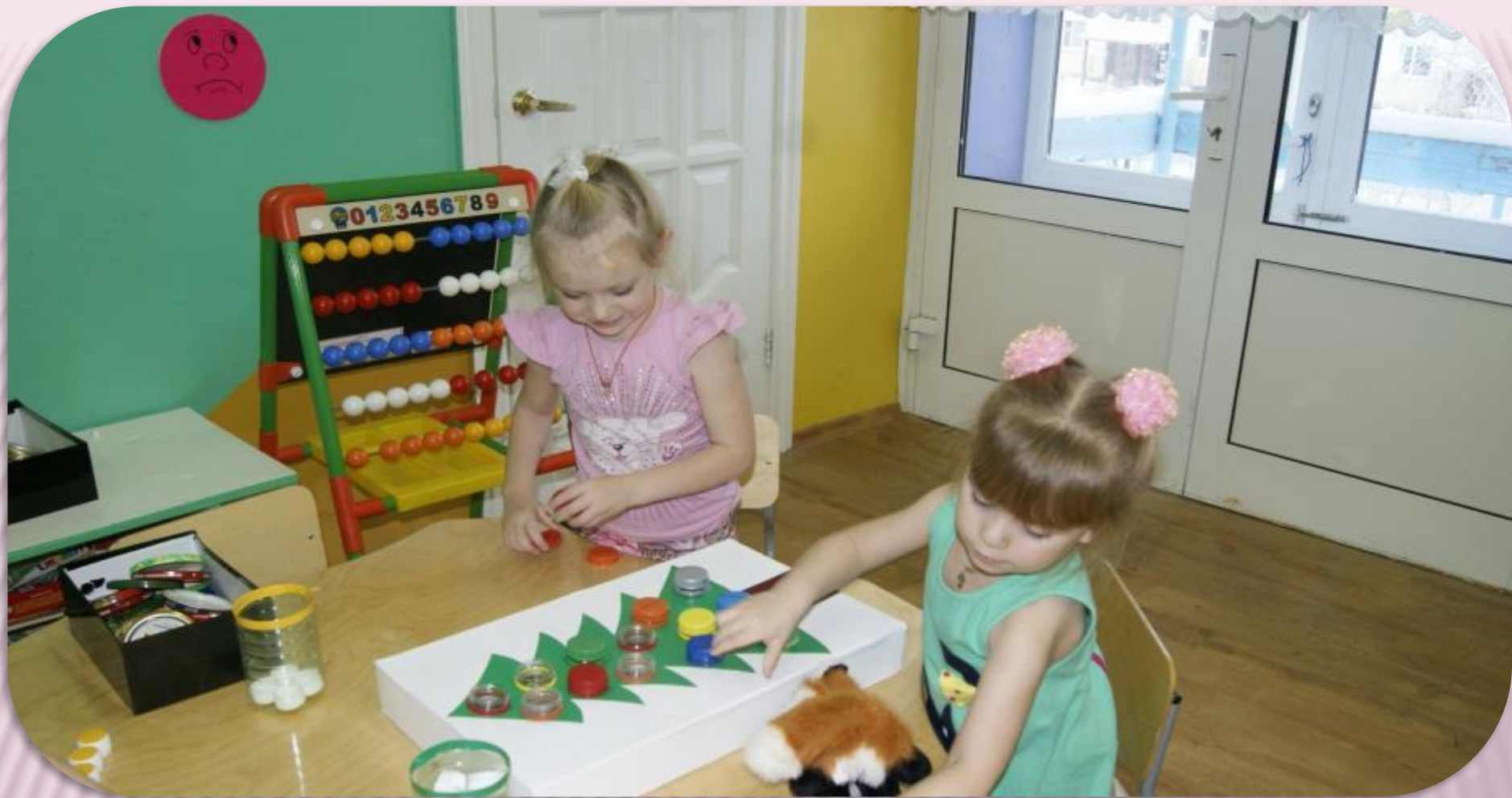
ДИДАКТИЧЕСКАЯ ИГРА «НАРЯДИ ЁЛОЧКУ»