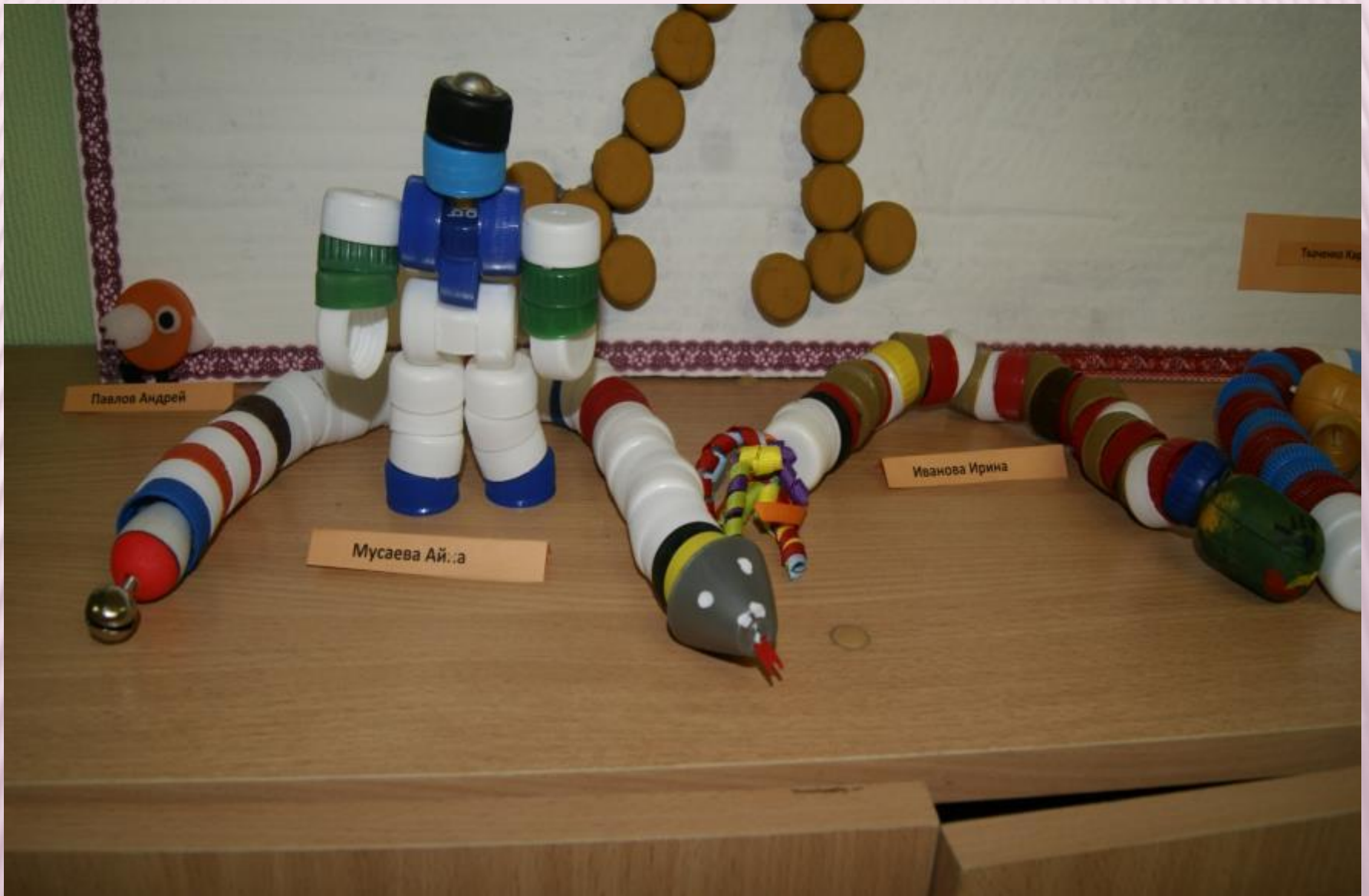
Семейный конкурс поделок «Забавные крышки»