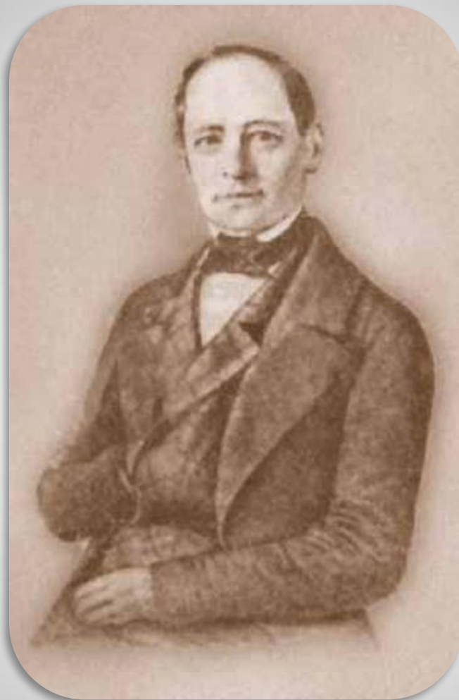
Леонтий Филиппович Магницкий