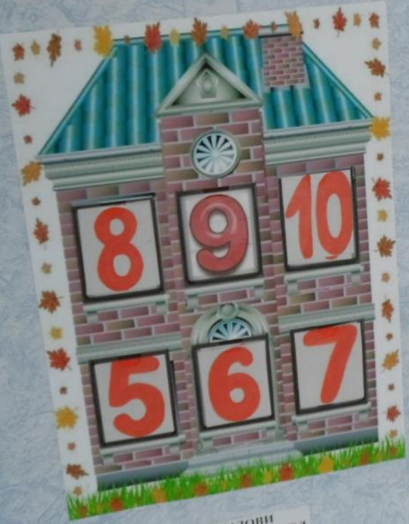
НАЗОВИ СОСЕДЕЙ ЧИСЕЛ