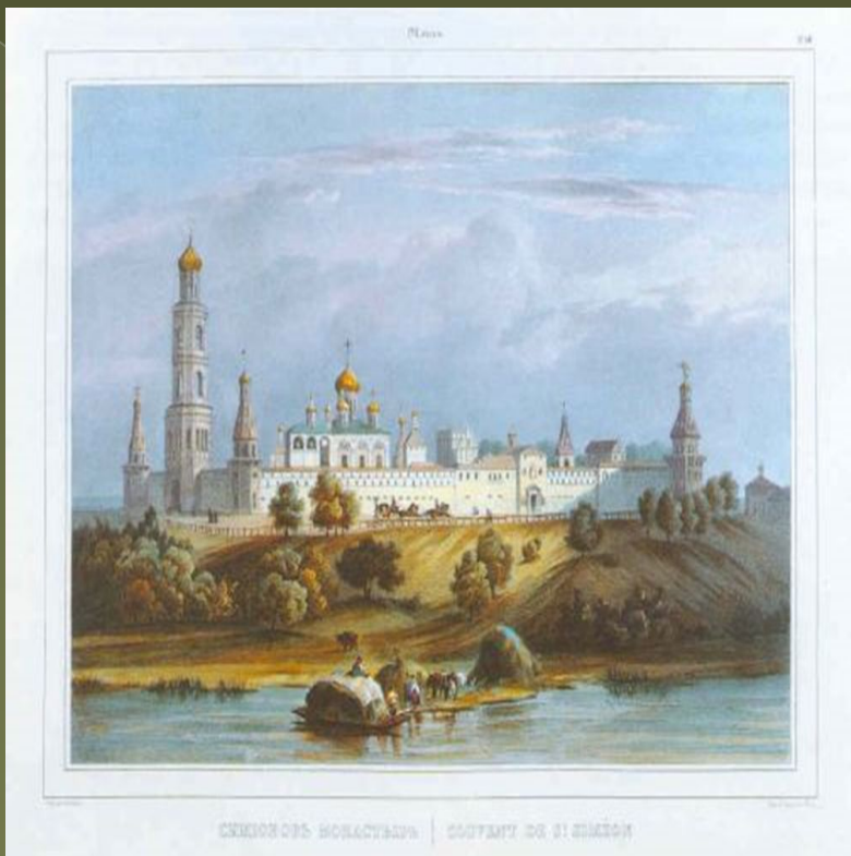
Московский Симонов монастырь