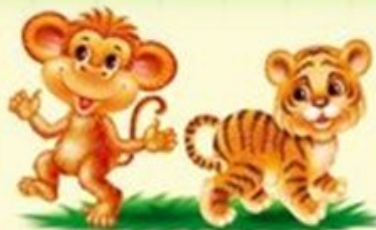
налево – направо