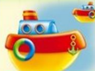
близко – далеко