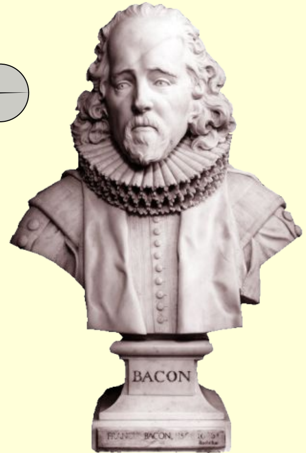
Ф. Бэкон. «Новый Органон».

Человек, слуга и истолкователь природы, столько совершает и понимает, сколько постиг в её порядке, делом или размышлением, и свыше этого он не знает и не может.