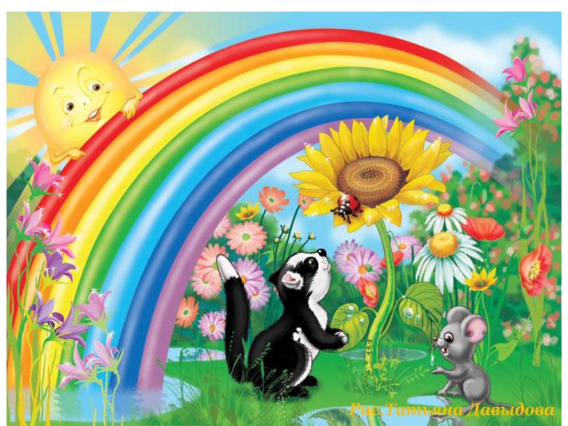
Рис. Татьяна Давыдова